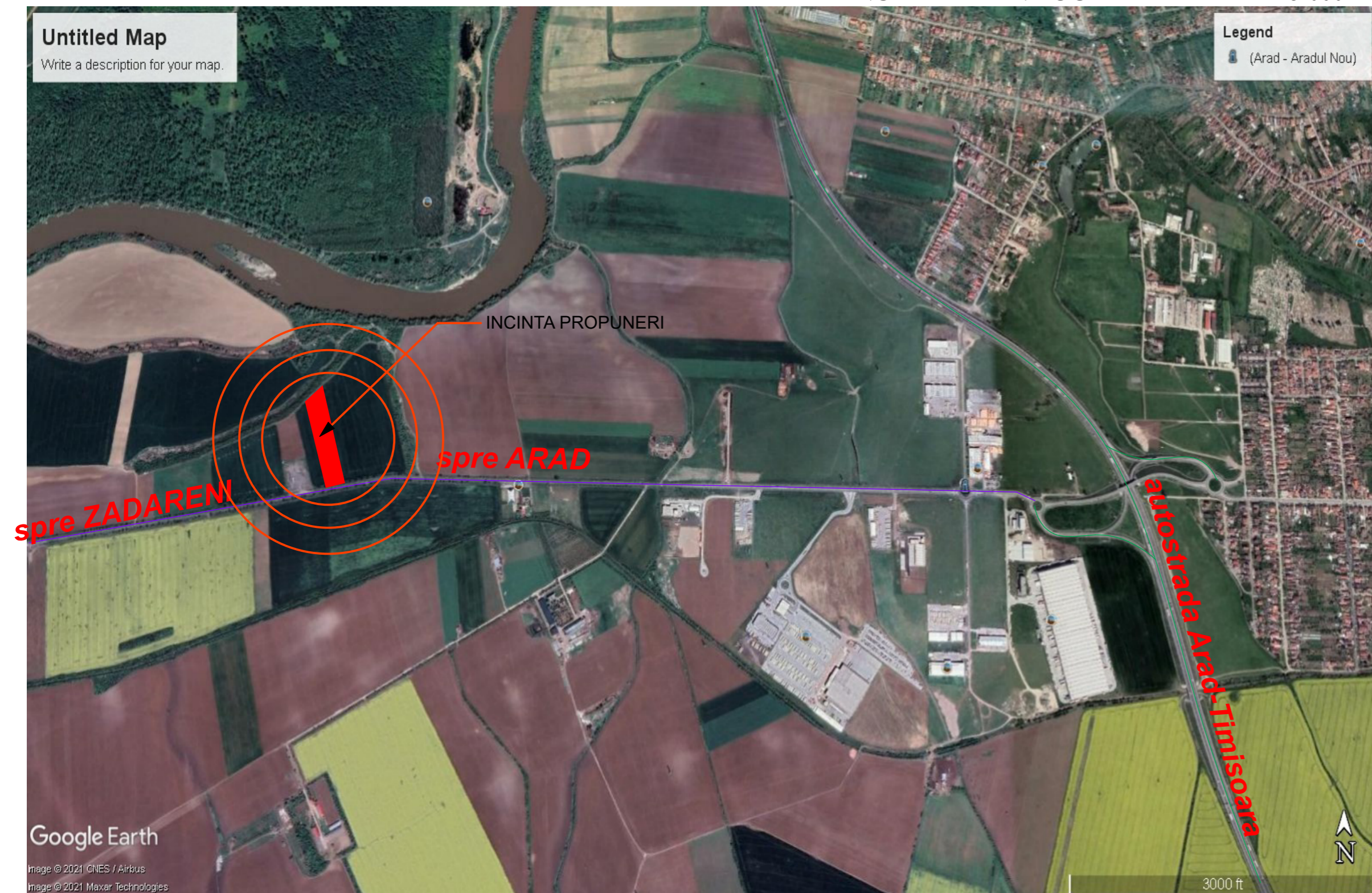
INCADRARE IN LOCALITATE - scara 1:5.000