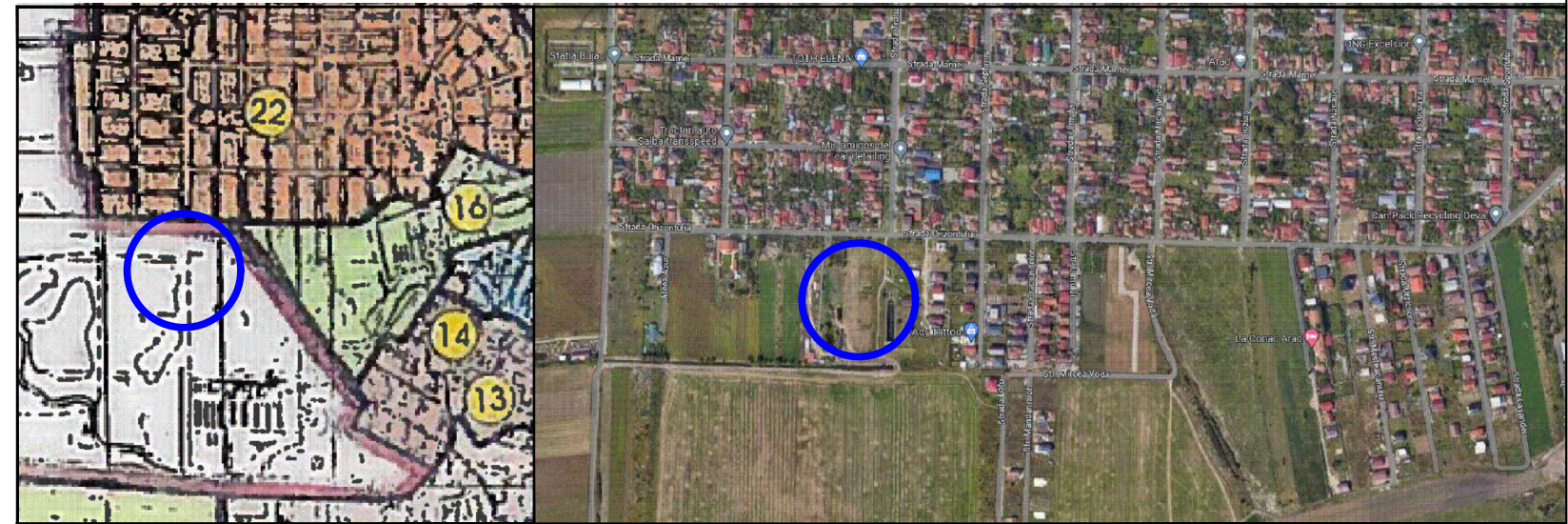
Încadrare în PUG Arad