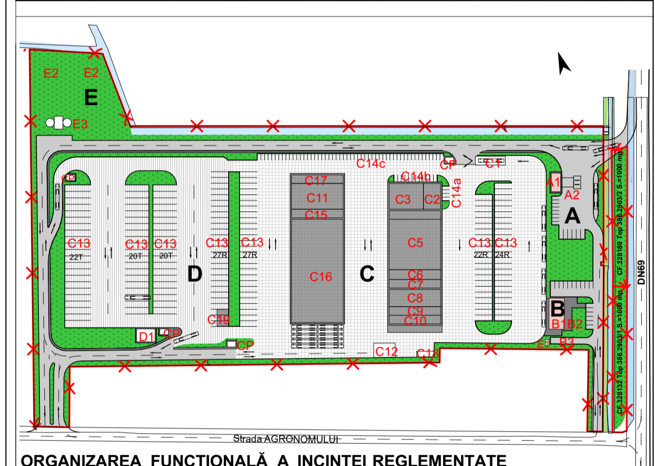
ORGANIZAREA FUNCȚIONALĂ A INCINTEI REGLEMENTATE