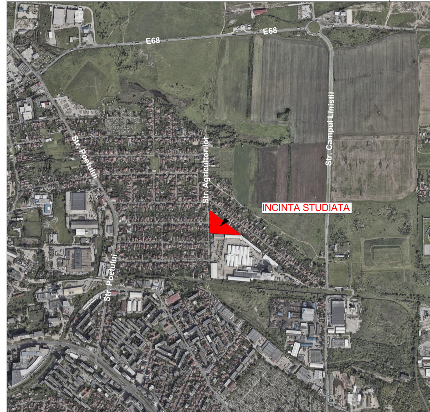
PLAN DE ÎNCADRARE ÎN ZONĂ

ÎNTOCMIRE P.U.Z. ȘI R.L.U.: „CONSTRUIRE ZONĂ REZIDENȚIALĂ ȘI FUNCȚIUNI COMPLEMENTARE”